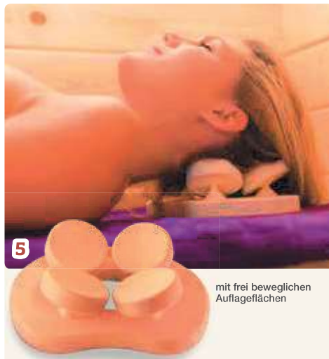
mit frei beweglichen Auflageflächen