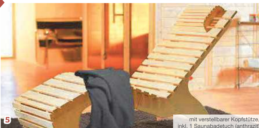
mit verstellbarer Kopfstütze, inkl. 1 Saunabadetuch (anthrazit)