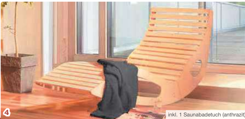
inkl. 1 Saunabadetuch (anthrazit)