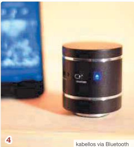
kabellos via Bluetooth