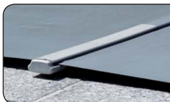
• Abgeflachte Beckenrand-Schutzverstärkung aus Kunststoff

HERAUSZIEHBARE EDELSTAHLSTIFTE MIT HÜLSE